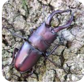
ノコギリクワガタ