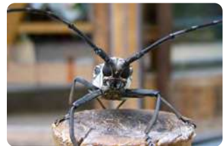
シロスジカミキリ