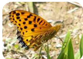
ツマグロヒョウモン