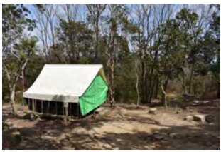
I II III 番 サイト