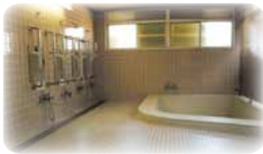
浴室・・・大小2つの浴室