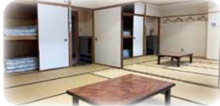
和室・・・一部屋 10畳で6人が泊れます。つなげて使用できる部屋もあります。