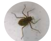
コオニヤンマのヤゴ