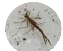
ハゲトロンボのヤゴ