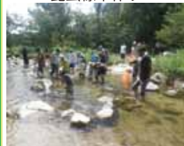
仁川の生き物調査