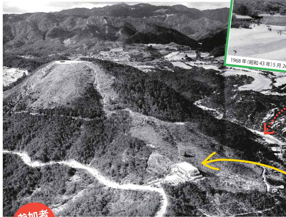
1968年(昭和43年)5月26日撮影

今回のふるさとウォークゴール会場となるキャンプ場リバーサイト。砂地の河原と岸辺に松林が見える。