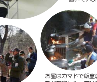
お昼はカマドで飯盒炊飯をしたり、バーベキューなどで楽しみ、夜は宿泊。キャンプ場利用と組み合わせ、盛りだくさんの活動ができます。