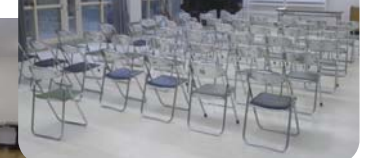
研修室は2タイプ。講義やワークショップにご利用ください。