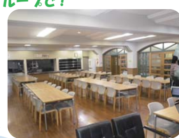
3食で2500円程度。夕食は特別メニュー(鍋、すき焼き)もあり、大人の方にはビールの販売も!