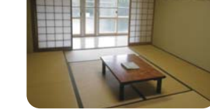
一部屋10畳で6人が泊れます。つなげて使用できる部屋もあります。