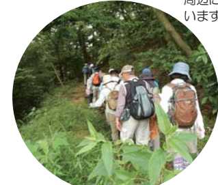
湿原保全活動やセンター主催の各種イベントも実施しています。