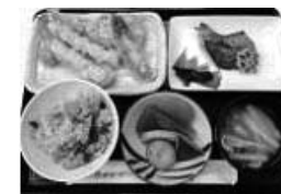
季節のごはん、天ぷら、 さわらの塩焼き(1000円)