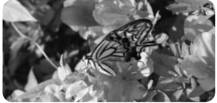
甲山自然学習館で羽化したナミアゲハ

発行：西宮市立甲山自然環境センター http://kabuto.leaf.or.jp 〒662-0001兵庫県西宮市甲山町67番地 TEL・FAX/0798-72-0037 企画：指定管理者NPO法人こども環境活動支援協会（LEAF）