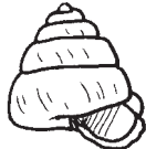
ニッポンマイマイ 1.7cm程度