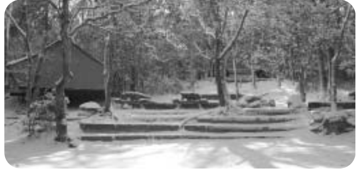
雪の甲山キャンプ場

発行：西宮市立甲山自然環境センター http://kabuto.leaf.or.jp 〒662-0001兵庫県西宮市甲山町67番地 TEL・FAX/0798-72-0037 企画：指定管理者NPO法人こども環境活動支援協会（LEAF）