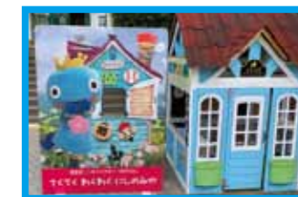
～みやたん顔出しパネル～ みやたん記念写真がとれるよ!