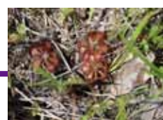
トウカイモウセンゴケ