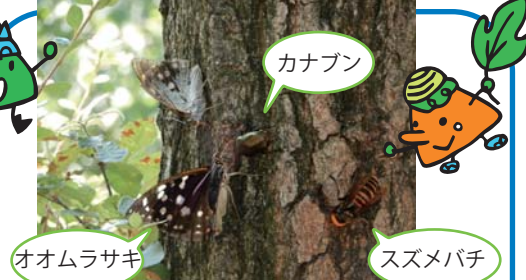
カナブン オオムラサキ スズメバチ