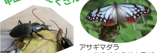
アサギマダラ ひらりひらりと飛び長距離を移動する