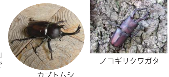
カブトムシ ノコギリクワガタ

カシノナガキクイムシが入り「ナラ枯れ」したコナラを伐採し、ビニールにくるんで薬剤燻蒸しています。