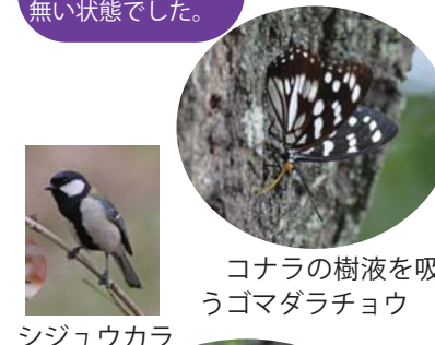
シジウカラ コナラの樹液を吸うゴマダラチョウ

ナラ枯れで伐採したコナラの年輪を数えると47本。約50年間で甲山周辺の自然環境が大きく変化していることがわかります。