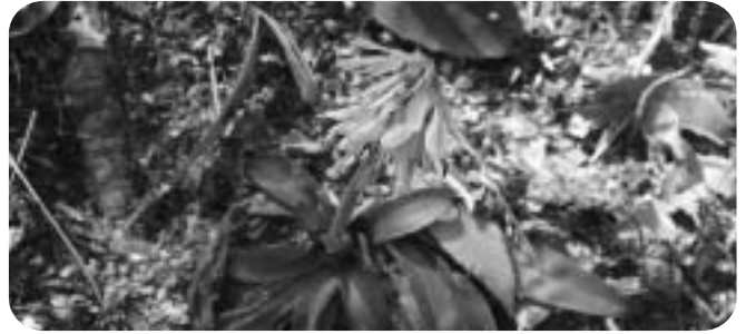
甲山湿原観察園のショウジョウハカマ

発行：西宮市立甲山自然環境センター http://kabuto.leaf.or.jp 〒662-0001兵庫県西宮市甲山町67番地 TEL・FAX/0798-72-0037 企画：指定管理者NPO法人こども環境活動支援協会（LEAF）