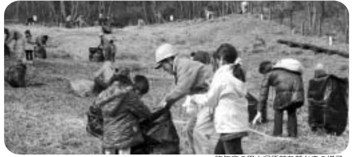
昨年度の甲山湿原落ち葉かきの様子

発行：西宮市立甲山自然環境センター http://kabuto.leaf.or.jp 〒662-0001兵庫県西宮市甲山町67番地 TEL・FAX/0798-72-0037 企画：指定管理者NPO法人こども環境活動支援協会（LEAF）